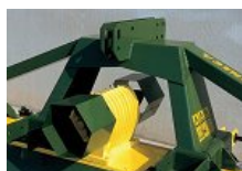
Menjalnik z ročko iz litega železa in ojačen priklop

MORENI Izvedba Tecnica idraulica opremljena z: