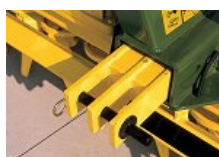
Giblji priklopi II in III razreda