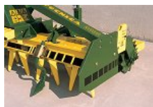
Čertolomilec in nastavljanje valja z bodicami