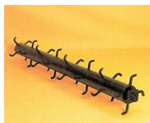
Valj s štrlinami