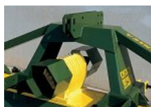
Menjalnik z ročko iz litega želaza in ojačen priklop

MORENI Izvedba Tecnica idraulica opremljena z: