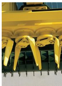
Gonila na dva prsta